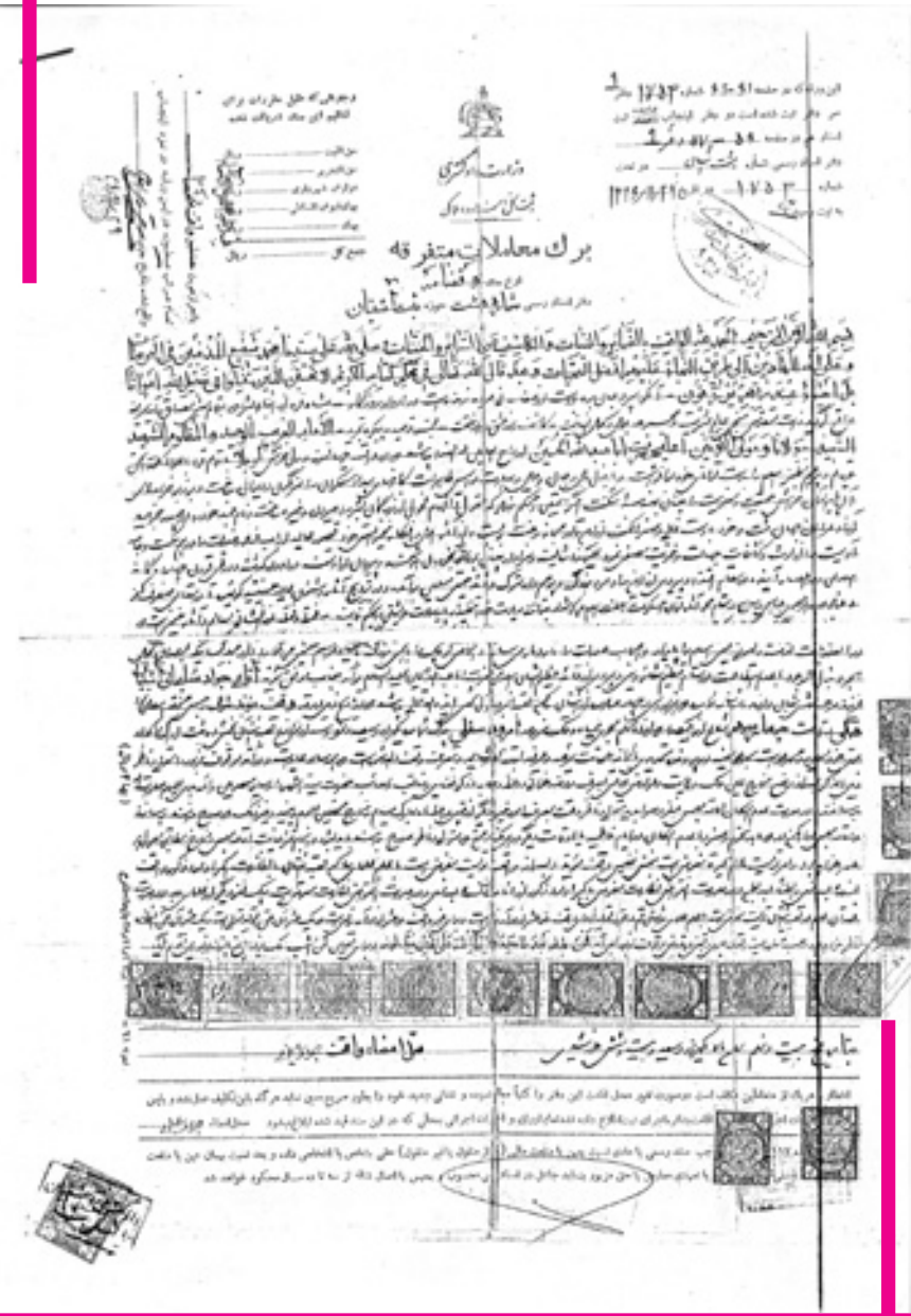
تصویر شماره ۴