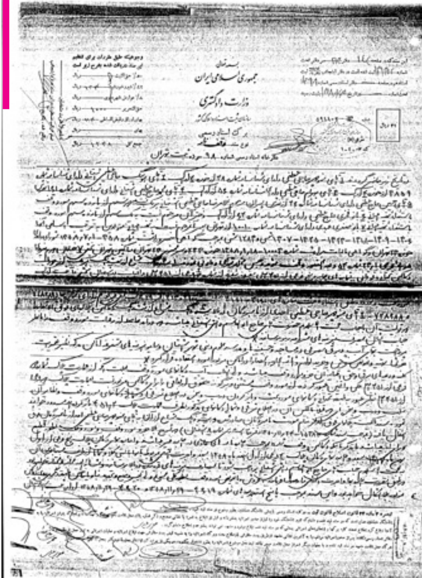
تصویر شماره ۶